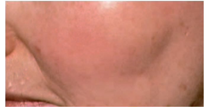
NACH DER BEHANDLUNG MIT IPL UND LASER