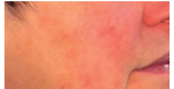
NACH DER BEHANDLUNG MIT IPL