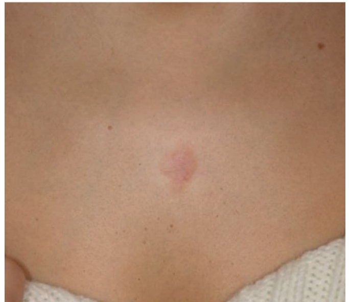
Abb. 1a-b: Keloid – Ausgangsbefund (l.) und Endergebnis nach 3 Kombinationsbehandlung mit Vereisung und intraläsionaler Triamcinolon-Acetonid-Injektion, gefolgt von 4 Behandlungen mit Farbstofflaser (r.).

blieben bei den Nachuntersuchungen nach 18 Monaten bis zu fünf Jahre frei von Keloiden. Eine vorsichtige Indikationsstellung (kleinere Keloide und hypertrophe Narben aufgrund der begrenzten Eindringtiefe des Lasers) und umfassende Beratung des Patienten ist unumgänglich, da es bei diesen Verfahren zu vergleichsweise schwerwiegenden Nebenwirkungen (wie beispielsweise Pigmentstörungen, lang anhaltende Rötungen und Narben-Neubildung) kommen kann. Wie auch bei den vorhergehenden Verfahren sind meist mehrere Sitzungen über einen Zeitraum von mehreren Monaten notwendig.